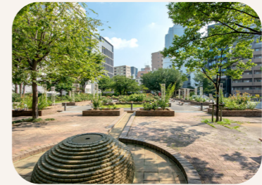
赤坂氷川公園 [DATA] 港区赤坂6-5-4