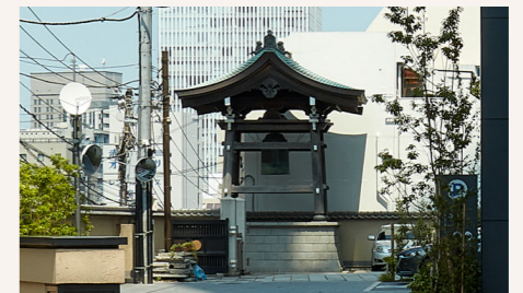
圓通寺 [DATA] 港区赤坂5-2-39