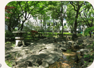
高橋是清翁記念公園 [DATA] 港区赤坂7-3-39