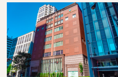
左) 山王メディカルセンター 下) 赤坂郵便局