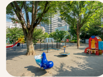
一ツ木公園 [DATA] 港区赤坂5-5-26 港区のなかでも特に急な坂として知られる三分坂(さんぶんざか)を登り切った高台にある公園。オフィスワーカーの憩いの場にもなっています。