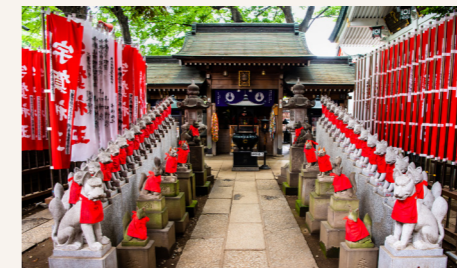
豊川稲荷 [DATA] 港区元赤坂1-4-7