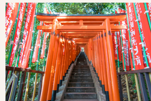
山王日枝神社 [DATA] 千代田区永田町2-10-5