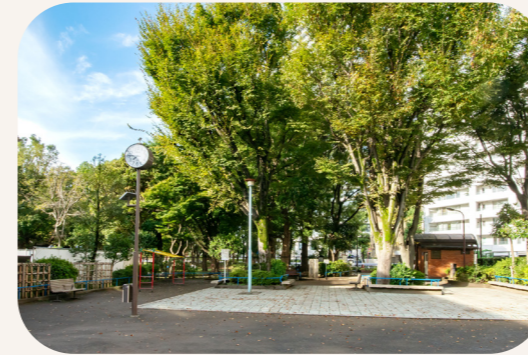
青葉公園 [DATA] 港区南青山1-4-4 ブランコ、滑り台、砂場などいろいろな遊具がある公園。夏場は4本の大きなケヤキの木が、気持ちのいい木陰をつくります。北側には岐阜県郡上市から区政70周年を記念して寄贈されたコブシの木が植えられています。